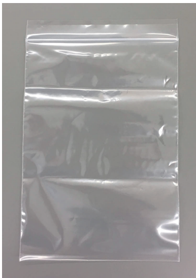
チャック付き袋 (実物写真)